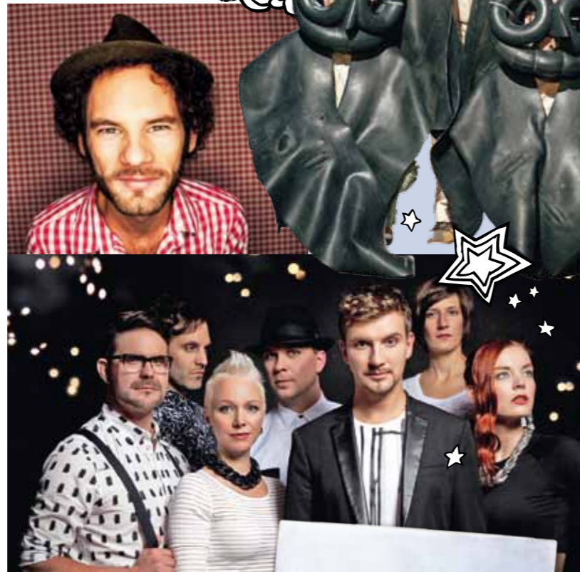
Die Preisträger der Freiburger Leiter 2014 geben sich die Ehre und die Chapertons aus Spanien geben Gummi!