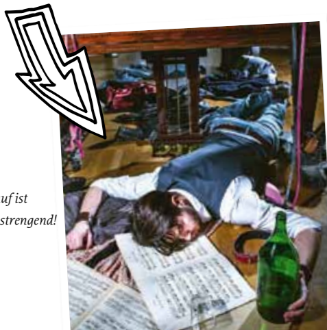
So ein Amoklauf ist ganz schön anstrengend!