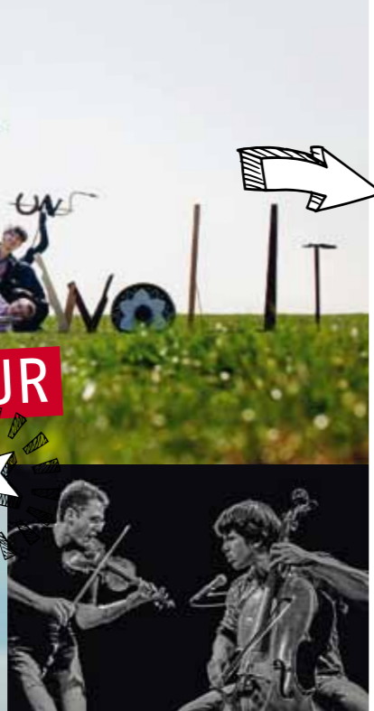
Zwei Streicher geben sich ganz dem Groove hin