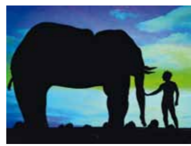
Die Mobilés stellen alles in den Schatten