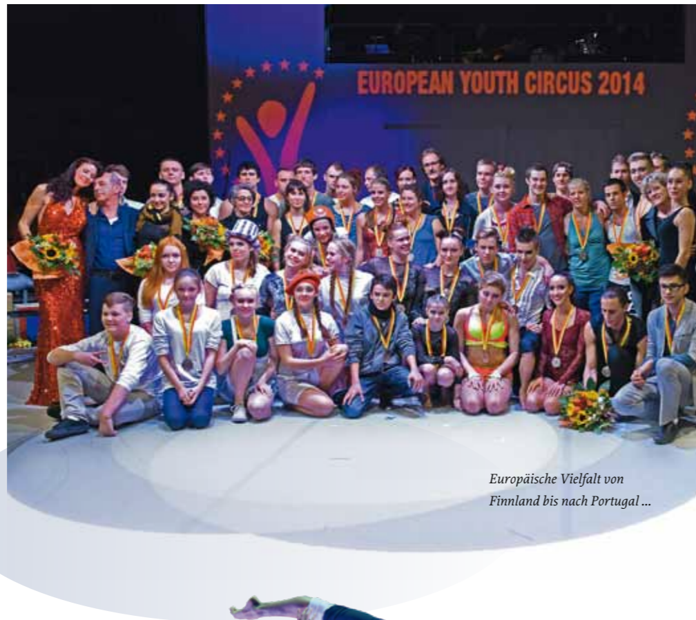
Europäische Vielfalt von Finnland bis nach Portugal ...