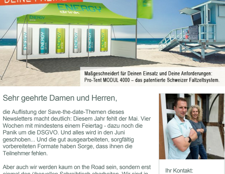
Maßgeschneidert für Deinen Einsatz und Deine Anforderungen. Pro-Test M50UL 4000 – das patentierte Schweizer Falzfallsystem.

Sehr geehrte Damen und Herren, die Auflistung der Save-the-date-Themen dieses Newsletter macht deutlich: Diesem Jahr feilt der Mai. Vier Wochen mit mindestens einem Feiertag - dazu noch die Panik um die DSGVO. Und alles wird in den Juni geschoben... Und die gut ausgearbeiteten, sorgfältig vorbereiteten Formate haben Sorge, dass ihnen die Teilnehmer fehlen.