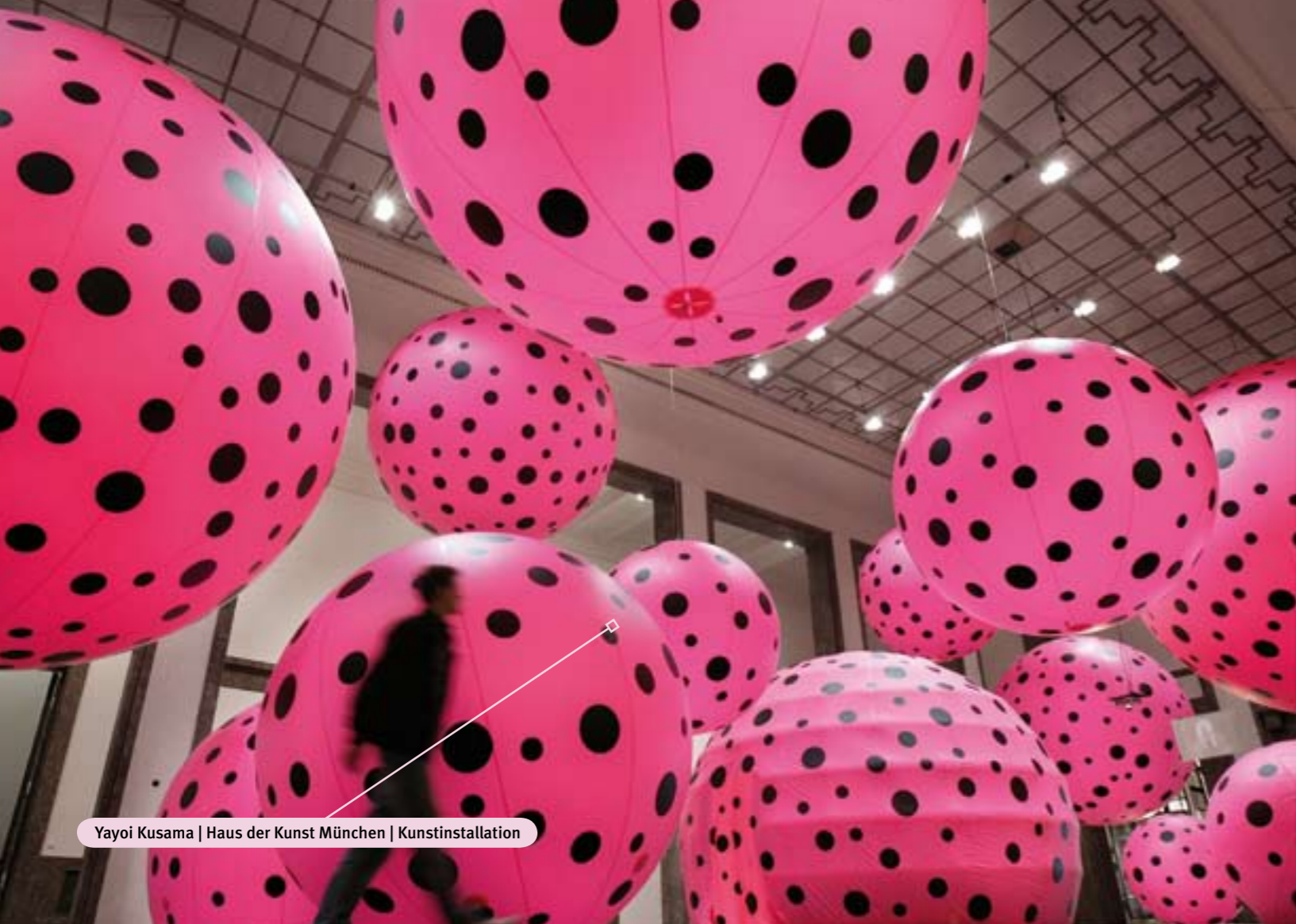
Yayoi Kusama | Haus der Kunst München | Kunstinstallation