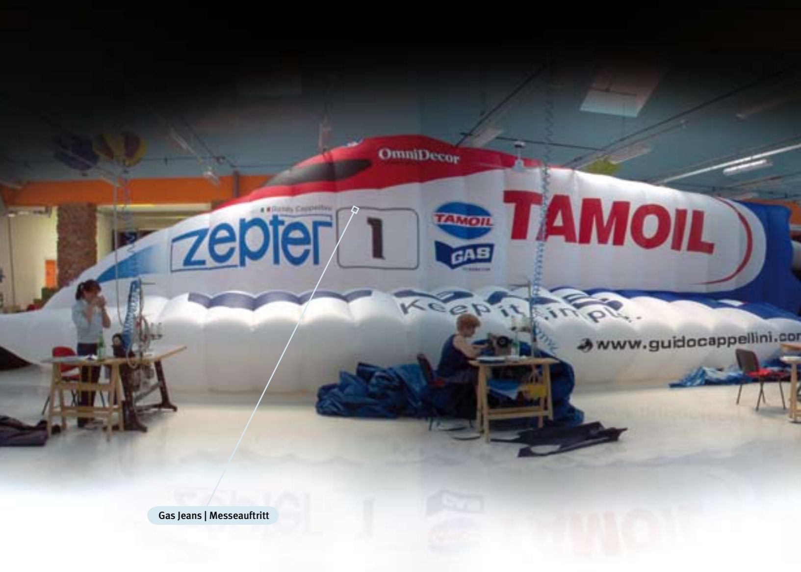
Gas Jeans | Messeauftritt