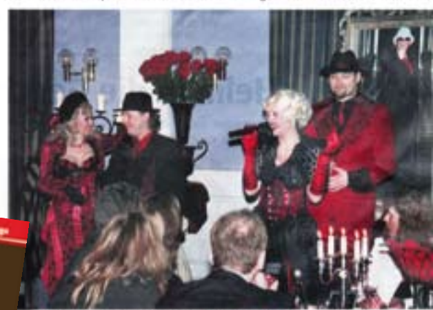
Engen bei Neuenburg, 192. Jahrgang. Veranstaltung des Publikums wird beim Mafia-Dinner der Paten Don Viggio am die Bühne steht. Zum Vier-Gänge-Menü gibt es eine Show mit Gesangsbeiträgen, Musikdarbietungen und Musik.

Der Paten ist tot. Die Vertreter der Tradition der Cosa Nostra sind der russischen Delinquenten wären auf ihren Gangster Don Viggio, den Paten einer der wichtigsten Mafia-Familie in seinem Casino in Las Vegas haben sie sich eingefügt. Mit seiner Geliebten zu kommen, und ihrer Gewählten verloren. Mord, Intrigen und eine schöne Pointe. Romanzi. Mit diesem Zitat verleiht die Schauspielerei dem Mafia- Dinner in der Neuen Schuler- burg die nötige Ehren allem sowohl, wie die Phantasie, die von Don Viggio, der hier in Form eines goldgeschmiedeten Bildes in Erscheinung tritt, zu sei noch bewacht, ver- fügt und noch bewacht, ver-