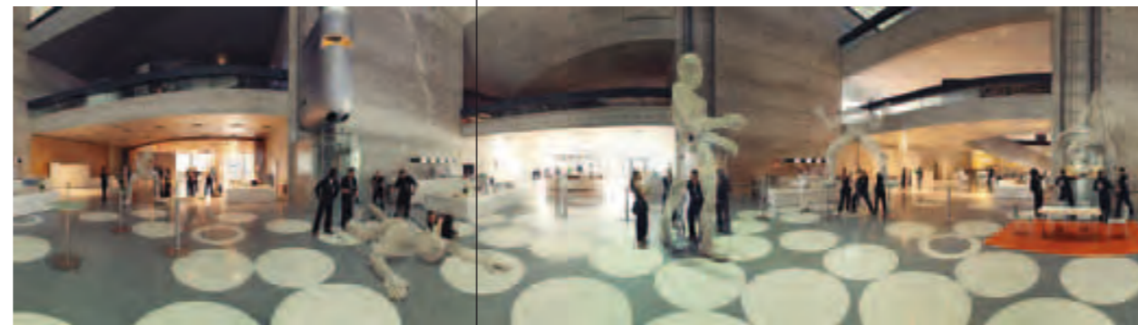
Dundu, wohin man schaut

Gewinner des Kleinkunstpreises Baden-Württemberg 2011