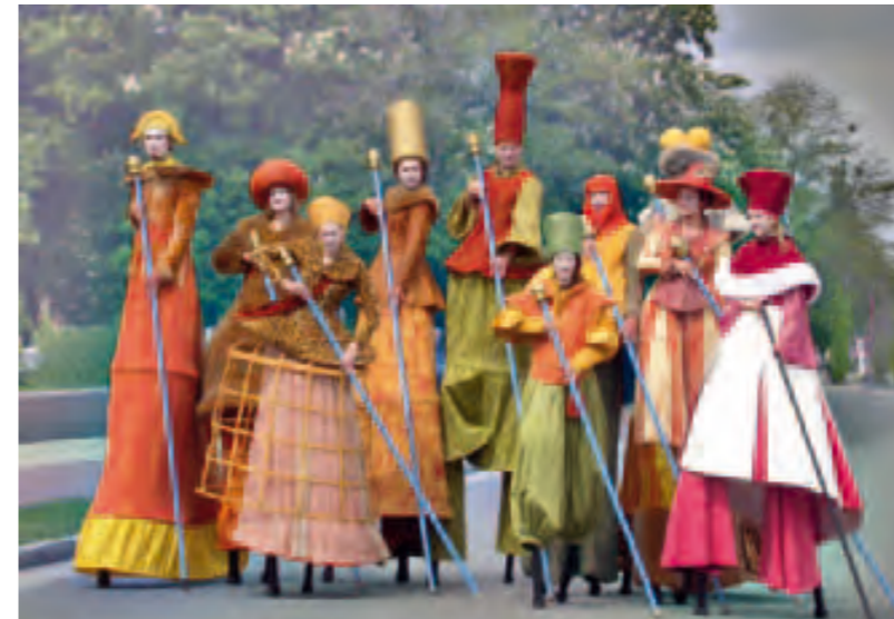
Entdecken die Welt neu: Die Stelzer