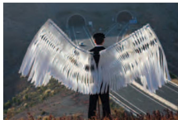
Gran Canaria: Mit Engeln zur Kulturhauptstadt 2016

Vom 15. April bis 16. Oktober findet die Bundesgartenschau in Koblenz statt. Das Zebra Stelzentheater und das Objekttheater AirDinger sind dort mit ihrem Programm »Frühlingszauber« unterwegs. Auf der Bundesgartenschau gastiert das Zebra Stelzentheater mit seinen Walk-Acts jeden Monat für sechs Tage, die PowerFlower von AirDinger ist noch einmal im Juli zu Gast.