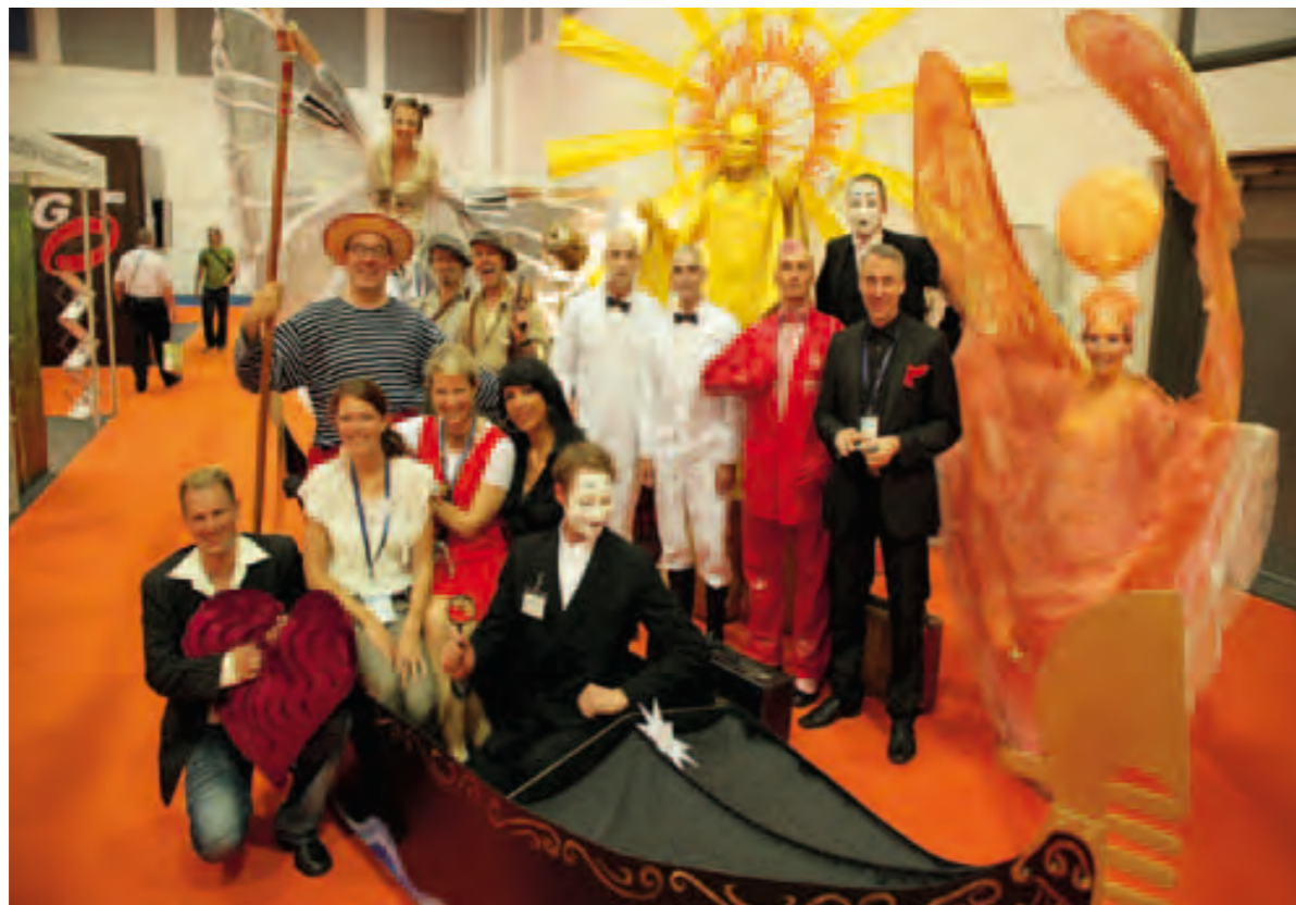
Alle in einem Boot: Das memo-media-Team und die Künstler der Artist Lounge auf der Showtech 2011.