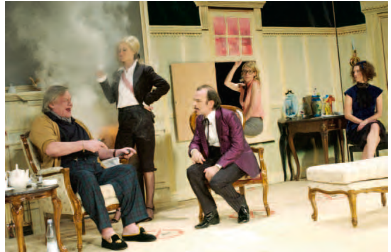
René Pollesch: Filmpreisträgerin Sophie Rois und Tatortkommissar Martin Wuttke haben was mit Volker Spengler.