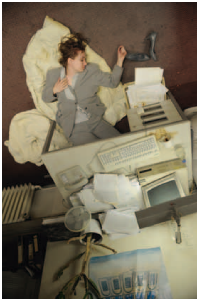
Signa: Rausch und Tausch mit den Realitäten

ehrte. Mit dem »Werk« war er auch schon da. Eine frische »Heilige Johanna« folgte (ebenfalls) in Berlin, wie zuletzt der Liederabend »Aufhören! Schluss jetzt! Lauter!«. Launiges Theater darf auch Spaß machen und sich im pythonesken Blödsinn verlieren!