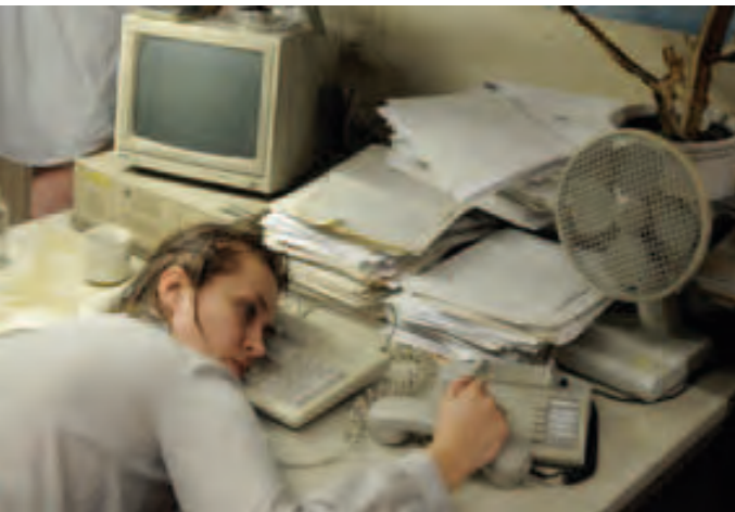
Performatives Theater, erschöpfend erzählt